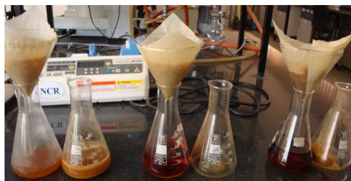
شکل ۲- عصاره‌های گال فیلتر شده با کاغذ صافی