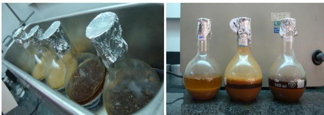
شکل ۱- پودر گال پس از قرار گرفتن در حلال و دستگاه سونیکاتور

عصاره‌گیری از گال‌ها با استفاده از متانول، استون و آب - ابتدا گال‌های جمع‌آوری شده A. persica در آزمایشگاه در دستگاه خردکن به خوبی آسیاب شد تا به پودر نرمی تبدیل