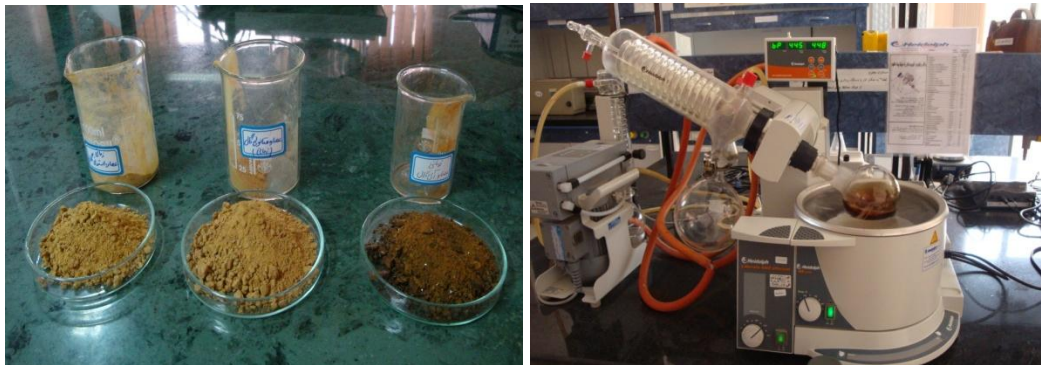
شکل ۳- جداسازی حلال از عصاره‌های تهیه شده از گال Aphelonyx persica و رسوب خشک حاصل

۱- ارزیابی رشد میسلیوم جدایه‌های قارچی در محیط کشت جامد حاوی غلظت‌های مختلف عصاره گال برای آماده کردن محیط‌های کشت جامد حاوی عصاره گال در غلظت‌های موردنظر، ۲۵، ۵۰ و ۷۰ میلی‌گرم در میلی‌لیتر از هر یک از عصاره‌های آبی، استونی و الکی گال به صورت استریل به محیط PDA اضافه گردید (Basri & Fan, 2005). به منظور اطمینان از عدم آلودگی، پلیت‌ها به مدت ۳ روز در زیر هود نگهداری و بعد تلقیح شدند. به این ترتیب که از جدایه‌های قارچی محیط کشت ده روزه تهیه و برای تعیین میزان رشد قارچ‌ها در محیط‌های جامد حاوی غلظت‌های مختلف عصاره گال، مقدار مساوی از حاشیه پرگنه در حال رشد جدایه‌ها بریده و با رعایت اصول و شرایط سترون به صورت وارونه به مرکز پتری‌دیش‌های محتوای غلظت‌های مختلف عصاره گال انتقال داده شد. سپس محیط کشت‌های تلقیح شده در انکوباتور در دمای ۲۴ درجه سلسیوس به مدت یک هفته نگهداری شدند. برای هر غلظت و هر جدایه سه تکرار در نظر گرفته شد. دو قطر عمود بر هم پرگنه هر یک از قارچ‌ها در محیط کشت‌های حاوی غلظت‌های مختلف عصاره‌های گال در هر تکرار بعد از یک هفته اندازه‌گیری شد. اندازه‌گیری بر حسب میلی‌متر انجام و میانگین‌ها و اعداد مربوطه برای هر جدایه محاسبه و ثبت شد. برای محاسبه میزان رشد میسلیوم، اندازه قطر دیسک‌های اولیه که روی محیط‌های کشت قرار داده شده بودند از اندازه قطر پرگنه کم شد. بر این اساس، میزان