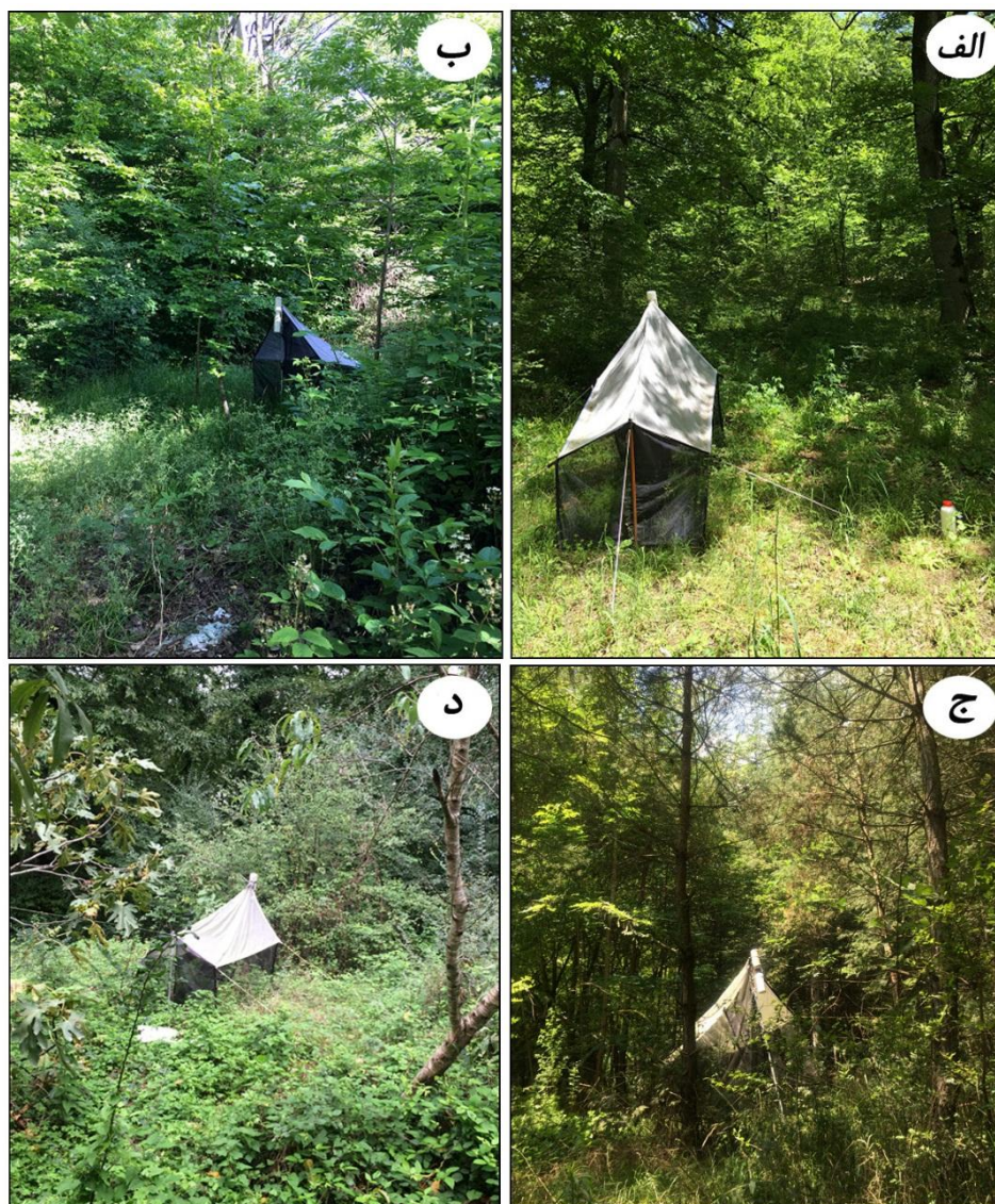
شکل ۱- محل نصب تله‌های مالیز در استان گلستان و مازندران: الف) لوه، ب) شמושک و مازندران، ج) هفت‌خال، د) شویلاشت