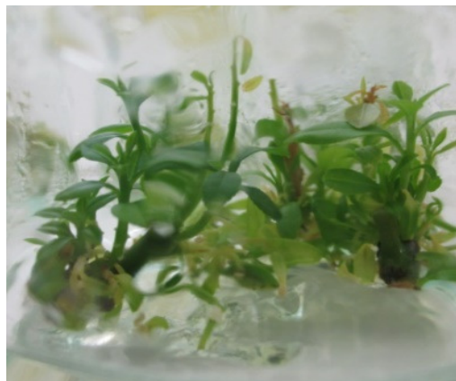
شکل ۱- پرآوری جوانه لیموی آب شیراز پس از ۴ هفته.

شیشه‌های مکارتی حاوی محیط کشت MS نیم غلظت به همراه ۶۰ و ۷۵ گرم در لیتر ساکاروز فاقد آگار و به جای آن از سیستم‌های حمایت کننده محیط کشت شامل پرلایت، ورمی کولایت و پل کاغذی و هم‌چنین پل کاغذی با MS کامل بودند. سیستم‌های حمایت کننده پرلایت و ورمی-کولایت قبل از کاربرد به مدت یک ساعت با آب مقطر شسته و کاغذ صافی به‌عنوان پل کاغذی مورد استفاده قرار گرفت. در آخرین مرحله شیشه‌ها توسط اتوکلاو در دمای ۱۲۱ درجه سانتی‌گراد و ۱/۲ اتمسفر به مدت ۲۰ دقیقه