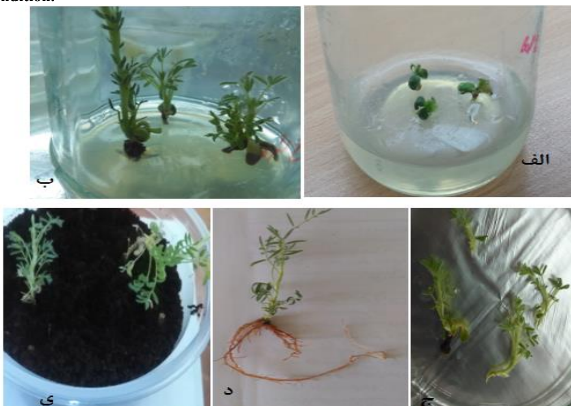
شکل ۳- مراحل باززایی گون (الف). کشت ریزنمونه (محورزیرلپه) در محیط شاخه‌زایی (ب). شاخه‌های تولید شده

(ج). شاخه‌های جدا شده (د). تولید ریشه از شاخه‌های باززا شده (ی). سازگاری گیاهچه‌ها در گلخانه.