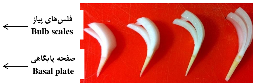
شکل 1. موقعیت‌های مختلف فلس جفتی در پیاز مادری (به ترتیب از راست به چپ: فلس جفتی گروه 1، 2، 3 و 4)

Figure 1. Various positional of twin scales in mother bulb (Right-to-left respectively: twin scale group 1, 2, 3, and 4)