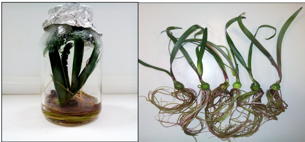
شکل 4. ریشه‌زایی گیاهچه‌های آماریلیس در مرحله تکثیری، در شرایط درون شیشه‌ای