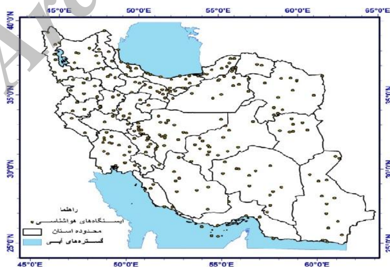
شکل ۱- شبکه ایستگاه‌های مطالعاتی

می‌کند. گاندو و ایسن (۶) نیز سه روش کریجینگ، کوکریجینگ و رگرسیون وزن‌دار جغرافیایی ۱ را برای پهنه‌بندی میانگین ۲۵ ساله بارش سالانه در ترکیه بررسی کردند. آنها با محاسبه ضریب همبستگی بین مقدار پیش‌بینی شده و الگو شده نتیجه گرفتند که روش رگرسیون وزن‌دار جغرافیایی با ضریب تبیین ۸۶٪ در مقایسه با روش کریجینگ و کوکریجینگ به ترتیب با ضرایب تبیین ۵۱٪ و ۶۷٪ درصد کمترین مقدار خطای پیش‌بینی را به خود اختصاص می‌دهد. قربانی (۵) روش‌های مختلف درون‌یابی قطعی و زمین‌آمار را با روش رگرسیون وزن‌دار جغرافیایی برای پهنه‌بندی و ترسیم نقشه هم‌بارش در استان گیلان مورد ارزیابی قرار داد و نتیجه گرفت روش رگرسیون وزن‌دار جغرافیایی در مقایسه با روش کریجینگ (در رتبه دوم کمترین خطا قرار داشت) به ترتیب با ریشه میانگین مربعات خطای برابر با ۱۴۷ و ۱۸۷ میلی‌متر با مقدار خطای کمتر می‌تواند در درون‌یابی و