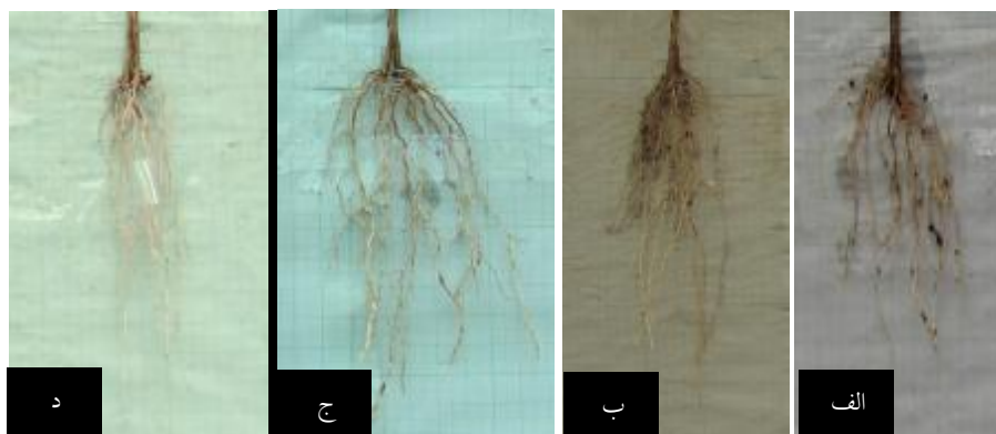
شکل ۲. ریشه‌های تشکیل شده در بسترها: الف) ماسه + پر لایت، ب) ماسه + کوکوپیت، ج) ماسه + کوکوپیت + پر لایت و د) ماسه

استوارتیا ( Stewartia pseudocamellia Maxim ) و سماق ( Rhus coriaria L. ) مثبت عنوان کردند.