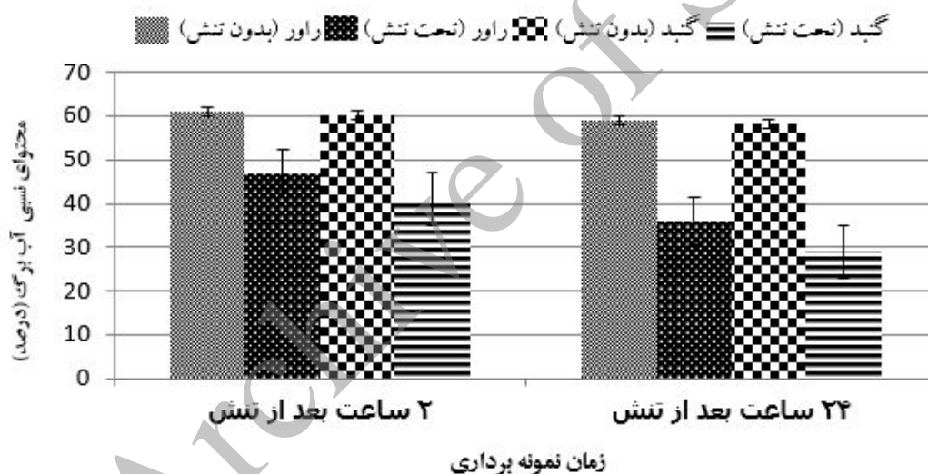
شکل ۱. تغییرات محتوای نسبی آب در اکوتیپ‌های متفاوت زیره سبز تحت تنش خشکی

**، * و ns به ترتیب معنی دار در سطوح احتمال ۱٪ و ۵٪ و بدون اختلاف معنی دار