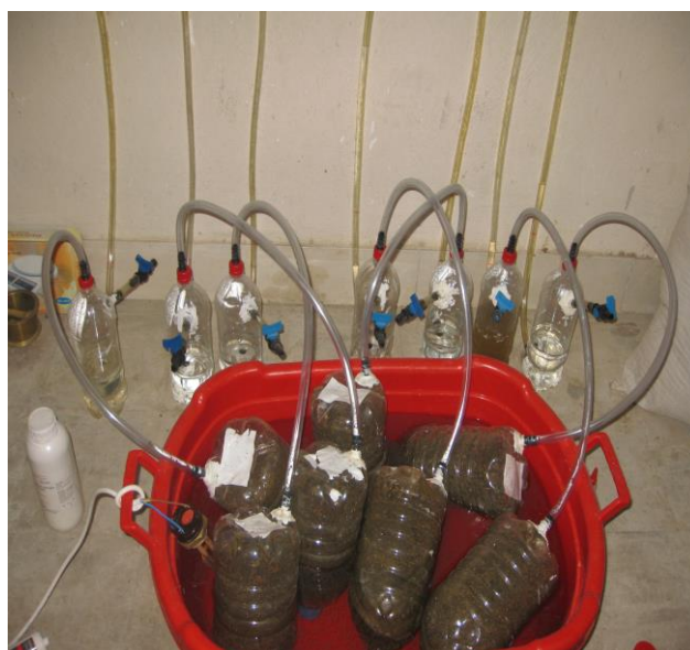
شکل (۱) مجموعه راکتورهای غیر پیوسته

درون آون ۹۰ درجه قرار گرفته‌اند را در یک بوته آزمایش خالی با وزن W_1 ریخته و بوته حاوی مواد را با استفاده از یک ترازوی دیجیتال مدل FX-300GD با دقت ۰/۰۰۱ گرم وزن کرده ( W_2 ) و درون کوره الکتریکی مدل Exciton، در دمای ۵۵۰ درجه سانتیگراد به مدت ۶ ساعت قرار داده شد. بعد از سپری شدن این زمان بوته خارج گردید و در درون دسیکاتور به منظور از دست دادن حرارت و جذب نکردن رطوبت قرار داده