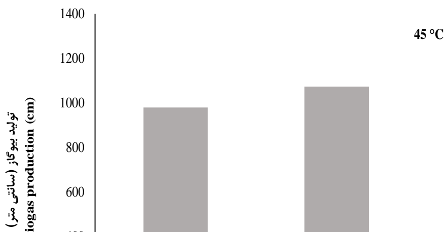
شکل (۳) بیوگاز تولیدی در نسبت‌های مختلف کود گاوی به باگاس نیشکر در دمای ۴۵ درجه سلسیوس Figure (3) Produced biogas in different ratios of manure to sugarcane bagasse at 45 °C