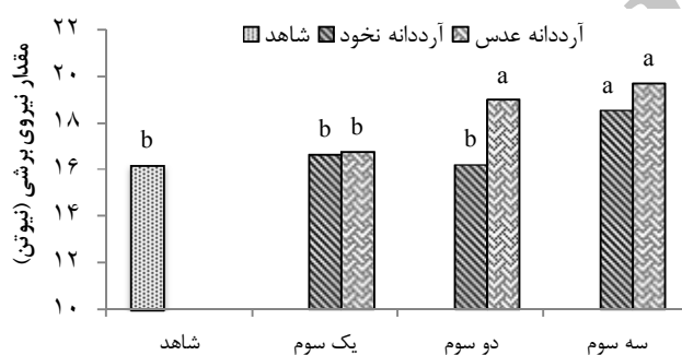
شکل ۱- میانگین مقدار نیروی برشی (نیوتن) در نمونه‌های سوسیس با درصدهای مختلف جایگزینی آرددانه نخود و عدس.

حروف آماری اختلاف معنی‌داری در هر ستون را نشان می‌دهد ( P > 0/05 ).