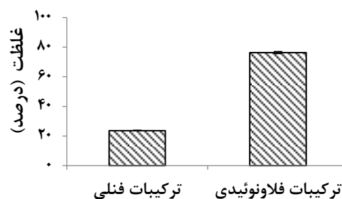
شکل ۱- مجموعهٔ ترکیبات شناسایی شده در عصارهٔ اتانولی بره‌موم به روش HPLC

شکل (۱) مجموعهٔ ترکیبات شناسایی شده در عصارهٔ اتانولی بره‌موم را با روش HPLC نشان می‌دهد. همان‌طور که در شکل (۱) مشاهده می‌گردد بیشترین مقدار ترکیبات شناسایی شده به این وسیله مربوط به مجموعهٔ ترکیبات فلاونوئیدی (شامل فلاونون‌ها، فلاون‌ها، فلاونول‌ها و فلاونوئیدها) (۷۶/۳۲ درصد) می‌باشد در حالی که مقدار مجموعهٔ ترکیبات فنلی (شامل کاتکین و اسیدهای گالیک، فرولیک و کافئیک) (۲۳/۶۸ درصد) به دست آمد. براساس این داده‌ها، مقدار ترکیبات فلاونوئیدی کمی بیشتر از سه برابر ترکیبات فنلی موجود در نمونهٔ بره‌موم بود. لازم به ذکر است که تعدادی از ترکیبات موجود در هر یک از این دو مجموعه دارای خاصیت آنتی‌اکسیدانی بودند که شامل کاتکین به عنوان ترکیب فنلی و اپی‌کاتکین و پینوسمیرین به عنوان ترکیبات فلاونوئیدی می‌باشند. این ترکیبات آنتی‌اکسیدانی در مجموع دارای مقداری در حدود ۲۱/۳۲ درصد بودند.