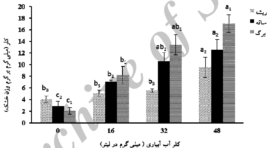
شکل ۲- اثر غلظت‌های کلر آب آبیاری بر میزان کلر در اندام‌های مختلف توتون (میانگین \pm SE). تفاوت‌های معنی‌دار بر اساس آزمون دانکن با حروف مختلف نشان داده شده است ( P < 0.01 ).