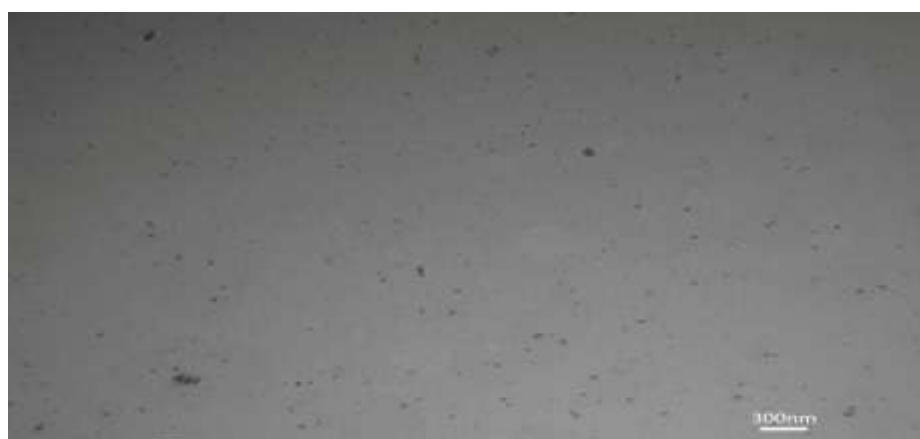
شکل ۲- تصویر میکروسکوپ الکترونی عبوری از نانوذرات اکسید روی سنتز شده توسط عصاره زیتون.