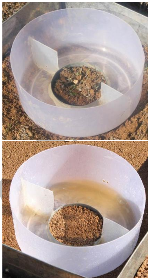
شکل ۲- فنجان پاشمان مورد استفاده در پژوهش بر روی خاک در دو حالت طبیعی (راست) و آماده‌سازی شده (چپ)

شکل ۲ نمایی از فنجان پاشمان مورد استفاده در پژوهش بر روی خاک در دو حالت طبیعی و آماده-سازی شده را نشان می‌دهد.