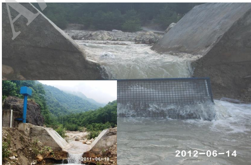
شکل ۲- نحوه استقرار نمونه‌بردار در پایین دست فلوم در حوزه آبخیز آموزشی-پژوهشی دانشگاه تربیت مدرس