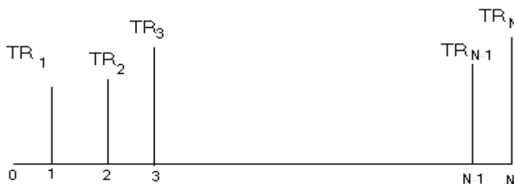
شکل ۱- یک سری هندسی مربوط به درآمدهای سالانه طرح

پ) ارزیابی اقتصادی طرح پخش سیلاب در ایستگاه مورد بررسی: برای این کار از معیارهایی نظیر نسبت فایده به هزینه، نرخ بازده داخلی و ارزش حال خالص استفاده شده است. در محاسبه این معیارها از نرخ تنزیلی معادل نرخ سود بهره وام بانکی در بخش کشاورزی و با فرض عمر ۱۵ سال استفاده شده و ارزیابی‌ها صورت گرفته است. هر چند که این طرح در واقع پروژه‌ای با طول عمر تقریباً بی‌نهایت است، ولی برای دوری جستن از برآورد هزینه‌ها و درآمدهای سالیانه در دوره‌ای طولانی که معمولاً به-دلیل تورم موجود دقیق نیستند، سعی شده در یک