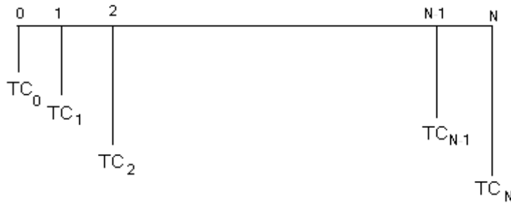
شکل ۲- یک سری هندسی مربوط به هزینه‌های سالانه طرح

ارزش خالص فعلی ( NPV ): مقدار این شاخص از لحاظ جبری می‌تواند برابر صفر، مثبت و یا منفی باشد که اگر NPV پروژه‌ای منفی شود، گفته می‌شود که توجیه اقتصادی ندارد و اگر مثبت شود، آن پروژه دارای توجیه اقتصادی است و چنانچه برابر صفر باشد، اجرا و عدم اجرای آن تفاوتی ندارد.