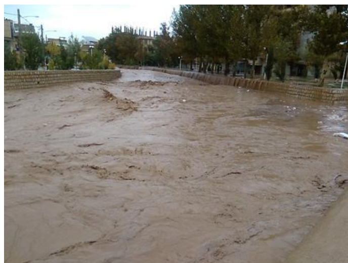
شکل ۳- جریان سیلابی حاوی سیلت و رس موجب تشدید خسارات سیل و هدررفت خاک و رسوب‌زایی زیاد است که بر اثر شخم در جهت شیب در دیمزارهای حاصل از تخریب جنگل‌های زاگرس رخ می‌دهد (سیل ۱۳۹۵ در ایلام، منبع خبرگزاری مهر، ۱۳۹۵)