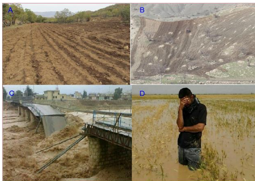
شکل ۲- خسارت سیل بهار ۱۳۹۵ به مزارع و پل‌های منطقه زاگرس، (A) تغییر کاربری جنگل‌های زاگرس و شخم اراضی جنگلی، (B) بدترین نوع شخم موازی شیب در اراضی مارنی با شیب حدود ۳۵ درصد، رس و سیلت حاصل از این شخم جریان سیل بنیان‌کن را در پایین‌دست (از جمله خوزستان) رقم می‌زند، (C) این قبیل سیل‌ها نتیجه تغییر کاربری جنگل‌های بالادست است (Heshmati و همکاران، ۲۰۱۷)، (D) کشاورز خوزستانی در مائم مزرعه از دست رفته‌اش، می‌داند که بیمه محصولات کشاورزی تنها بخش بسیار اندکی از هدررفت دست‌رنج یک‌ساله‌اش را جبران می‌کند

* تفاوت معنی‌دار در سطح پنج درصد و NS عدم تفاوت معنی‌دار