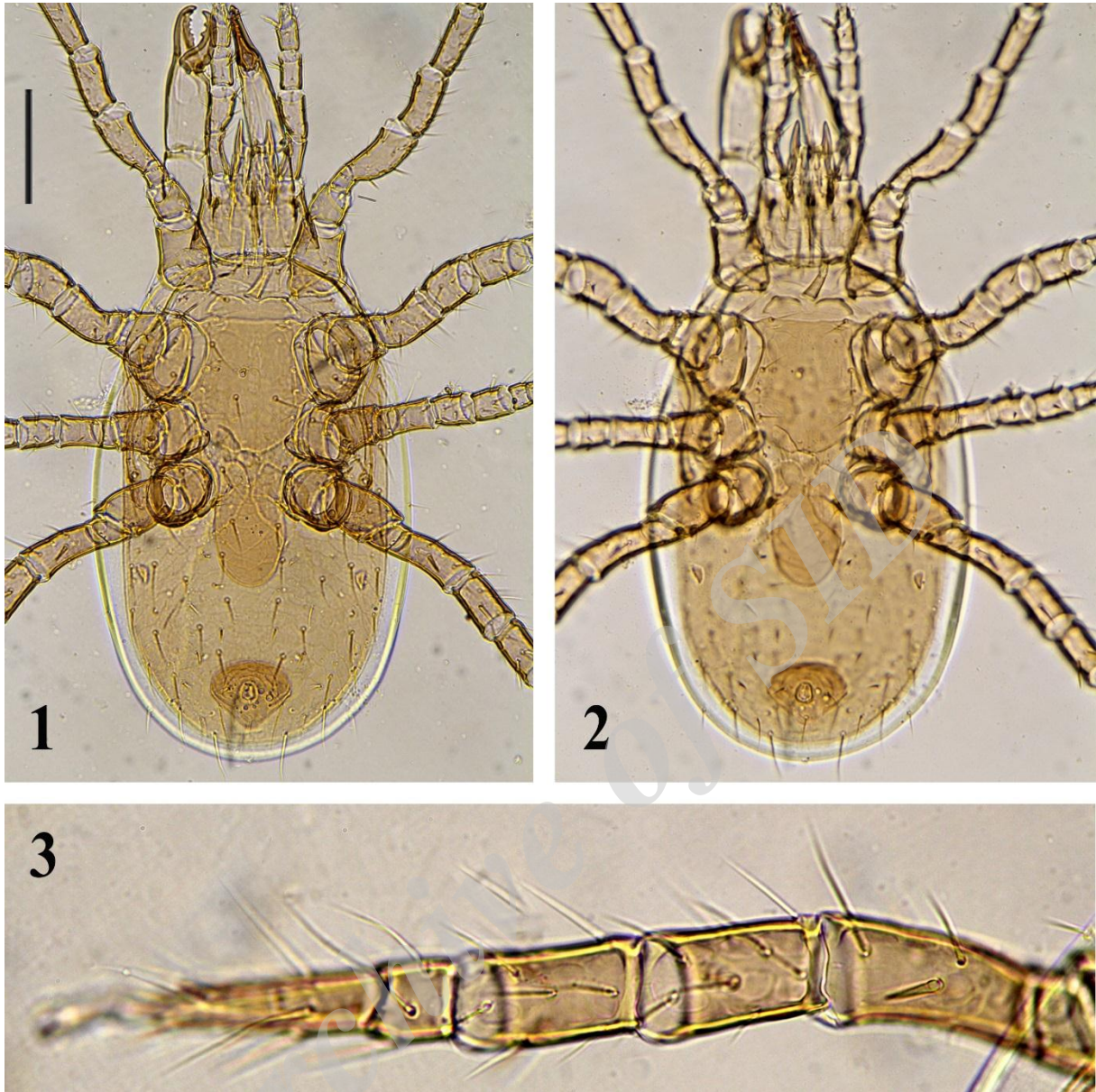
شکل های ۱-۳- کنه بالغ ماده Gaeolaelaps iranica : ۱- نمای پشتی، ۲- نمای شکمی، ۳- پای چهارم (اصلی). خط مقیاس برای شکل های ۱ و ۲ برابر ۱۰۰ میکرون.

Figures 1-3. Gaeolaelaps iranica adult female: 1- Dorsal view, 2. Ventral view, 3. Leg IV (Original).