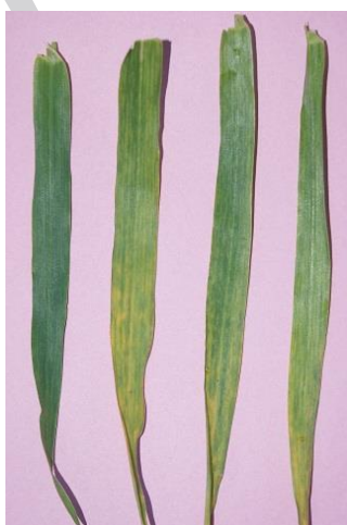
شکل ۱- نمونه اول از سمت چپ نمونه سالم و سایر نمونه‌ها، نمونه‌های آلوده مایه زنی شده با ویروس موزاییک رگه‌ای گندم در گلخانه.