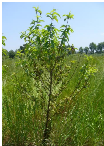
شکل ۳- تصویری از درختان هلوی حساس و مقاوم به بیماری پیچیدگی برگ هلو (راست: رقم حساس اسپرینگ تایم، چپ: رقم مقاوم ردهاون)

بیماری قابل انتظار بود. اما مقایسه‌ی شدت بیماری در ارقام مختلف نشان می‌دهد چنانچه از ارقام حساس به بیماری استفاده شود، سم‌پاشی با قارچ‌کش‌های مناسب ضروری می‌باشد در غیر این صورت احتمال طغیان بیماری وجود دارد و خسارت فراوانی به بار خواهد آمد. ولی چنانچه از ارقام مقاوم به بیماری پیچیدگی برگ مثل ردهاون و آمسدن استفاده شود، شدت بیماری در حدی نخواهد بود که نیاز به مصرف قارچ‌کش باشد. ردهاون یکی از ارقام تجاری و رایج در ایران است که بازار پسندی خوبی دارد. زمان رسیدن آن اواخر تیرماه است. گوشت آن بافتی نرم و زرد رنگ با کیفیت عالی دارد. این رقم مقاومت بالایی به سفیدک سطحی داشته و اگر خوب از آن مراقبت شود به سرما نیز مقاوم است (پریموز و همکاران ۲۰۱۱). آمسدن یک رقم تجاری زودرس است که به خصوص در مناطق گرم سازگاری خوبی دارد. این رقم هسته جدا با اندازه متوسط و رنگ گوشت آن سبز یا کرم متمایل به سفید است. طعم آن شیرین و بسیار خوش بو