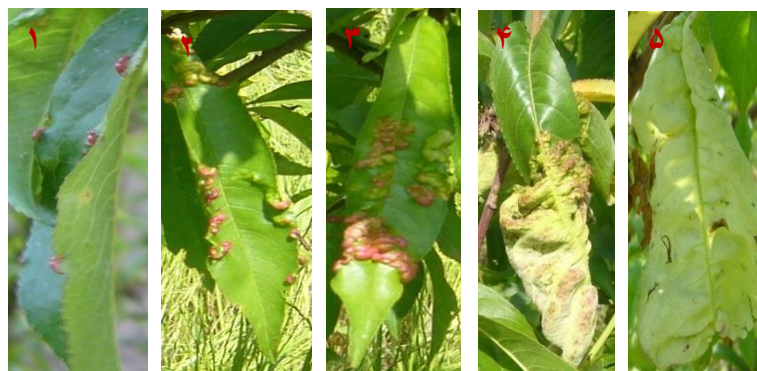
شکل ۱- درجات مختلف علائم بیماری پیچیدگی برگ روی برگ‌های هلو (درجات ۱ تا ۵ به ترتیب از چپ به راست).

یکدیگر بعد از ارقام کال دسی ۲۰۰۰ و جولای آلبرتا دارای بیشترین میزان شدت بیماری در بین سایر ارقام بودند و بر اساس تیپ واکنش ارقام نیمه مقاوم (MR) طبقه‌بندی شدند. یازده رقم باقیمانده مورد بررسی همگی در یک گروه آماری قرار گرفتند و شدت بیماری در آن‌ها از لحاظ آماری اختلاف معنی‌داری نداشت. ولی از لحاظ تیپ واکنش ارقام، آمسدن، ردهاون، اسپرینگ کرسست و فایت بسیار مقاوم (HR) و بقیه‌ی ارقام در گروه مقاوم (R) قرار گرفتند. از لحاظ مقدار عددی کمترین میزان شدت بیماری در کلیه‌ی ارقام مورد بررسی مربوط به رقم آمسدن و برابر ۰/۵ درصد بود (جدول ۴، شکل ۲).