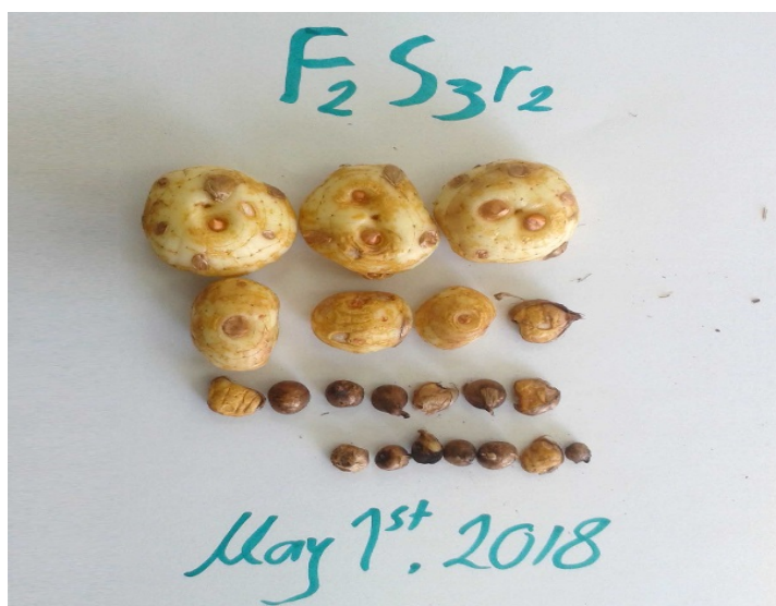
شکل ۳. بنه‌های دختری برداشت شده از مزرعه زعفران پس از اتمام دوره رشد گیاه در اردیبهشت‌ماه (بنه‌ها متعلق به تکرار ۲ تیمار کود دامی-بنه بزرگ می‌باشند).

اما با توجه به اینکه اکثر بنه‌های دختری تولید شده در تمامی تیمارهای مورد آزمایش وزنی کمتر از ۴ گرم داشتند، امکان تفکیک بنه‌های دختری در گروه‌های وزنی و بررسی تفاوت بین تیمارهای مختلف وجود نداشت. با این وجود مشخص شد که ۸۶/۸ درصد از تعداد و ۴۶/۶ درصد از وزن کل بنه‌های دختری بدست آمده در این آزمایش متعلق به بنه‌های با وزن کمتر از ۴ گرم بودند (نتایج نشان داده نشده است). اما تیمارهای کودی مختلف در این آزمایش بلحاظ