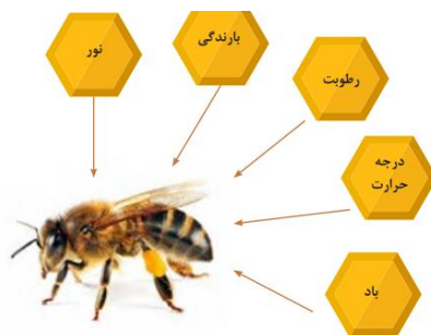
شکل ۱- ارتباط زنبورعسل با عناصر هوا و اقلیم‌شناسی (۹) Figure 1. The relationship between honey bee and climate variables