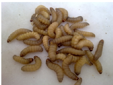
شکل ۲- لارو سن آخر پروانه ی موم خوار G. mellonella .

واژه های کلیدی: شب پره ی مینوز، گوجه فرنگی، کنترل بیولوژیک، نماتد انگل حشرات