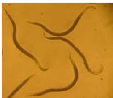
شکل ۱- لارو سن سوم S. feltiae .