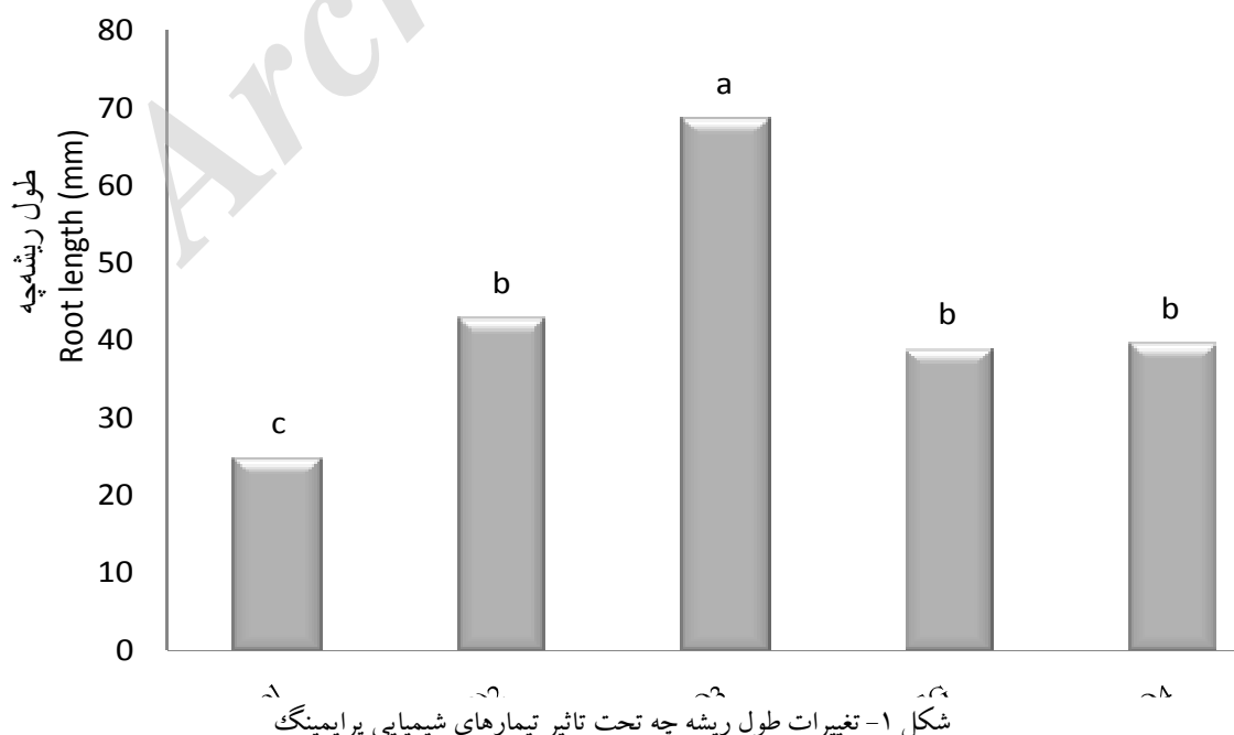
Fig. 1- Changes in root length under different chemicals priming

در هر ستون تیمارهایی که دارای حداقل یک حرف مشترک هستند از نظر آماری در سطح ۵ درصد آزمون دانکن فاقد تفاوت آماری می‌باشند. In each column, treatments with at least one common letter, have not significant difference at 5% of Duncan test.