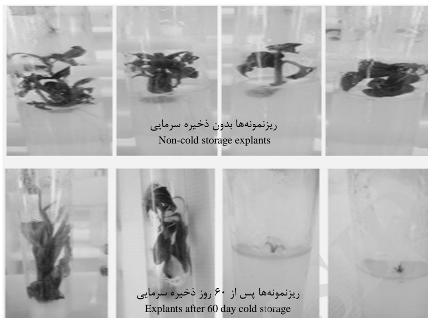
شکل ۲- کاهش رشد ریزنمونه‌ها پس از نگهداری در دوره‌های سرمایی (به ترتیب از راست به چپ، نوک شاخه‌های کپسوله نشده، نوک شاخه‌های کپسوله شده در ماتریکس آلژینات حاوی آب مقطر، نوک شاخه‌های کپسوله شده در ماتریکس آلژینات حاوی محیط کشت استاندارد و نوک شاخه‌های کپسوله شده در ماتریکس حاوی محیط کشت استاندارد و تنظیم کننده‌های رشد گیاهی)