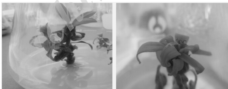
شکل ۳- پدیده نامطلوب گلدهی پیش از بلوغ در ریزنمونه‌های رویشی کپسوله نشده