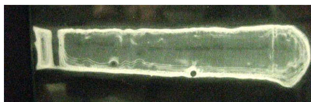
شکل ۴- کشش سطحی فیلم پلیمر سنتز شده Figure 4- The surface tension of the synthesized polymer

غیرعادی در شرایط پوشش دار کردن بذر با پلیمر خارجی (به میزان ۱/۰ گرم در صد گرم بذر) و داخلی (به میزان ۳/۵ گرم در صد گرم بذر) به ترتیب با کاهش ۱/۵۵ و ۱/۷۲ درصد، تأثیر کمتری نسبت به سایر سطوح کاربرد پلیمر داخلی داشت (جدول ۲). از آنجا که درصد گیاهچه های غیرعادی به عوامل ژنتیکی و محیطی مختلفی وابسته است، چگونگی تأثیر پلیمرها بر کاهش درصد گیاهچه های غیرعادی از طریق تغییر اثرات محیطی نیازمند بررسی های بیشتری است (Almedia et al., 2005; Zamani et al., 2018).