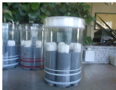
شکل ۱- نحوه اندازه‌گیری آزمایش و طول ریشه‌چه