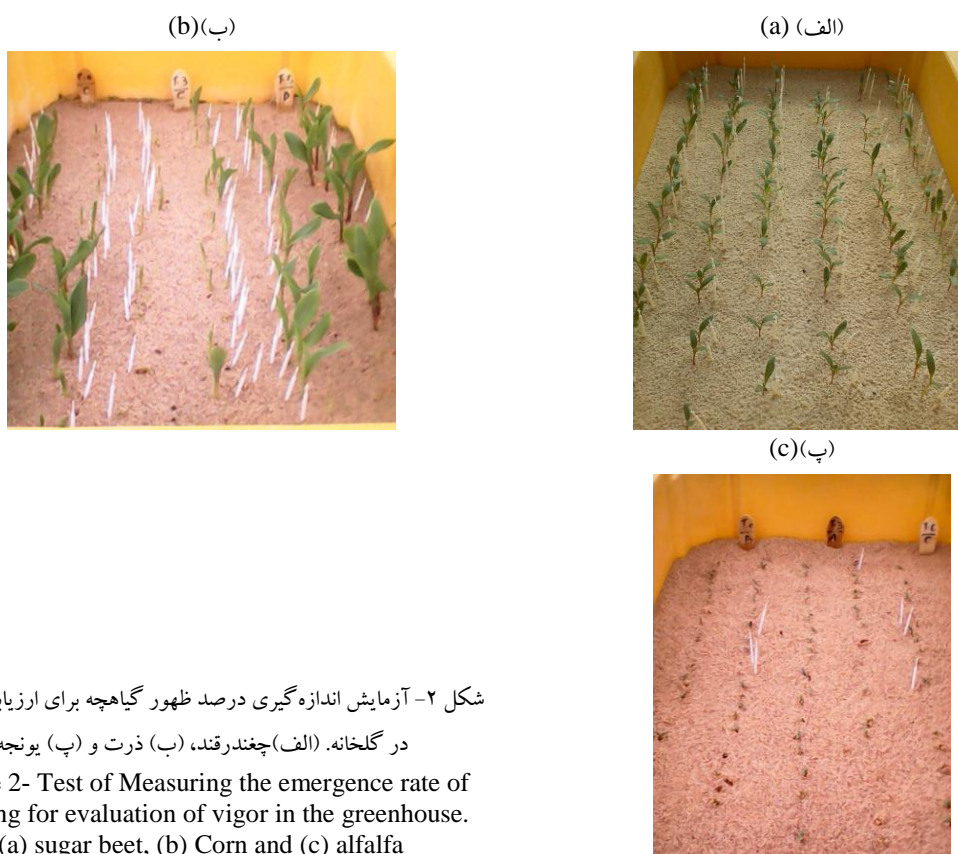
شکل ۲- آزمایش اندازه‌گیری درصد ظهور گیاهچه برای ارزیابی بینه بذر در گلخانه. (الف) چغندر قند، (ب) ذرت و (پ) یونجه

برای اندازه‌گیری درصد ظهور گیاهچه در گلخانه برای ارزیابی بینه بذر هر سه نوع بذر در گلخانه نیز کشت شدند. بذرها در جعبه‌های حاوی سیلیس و در قالب طرح کامل تصادفی با چهار تکرار کشت شدند. دمای گلخانه شبانه روز به طور ثابت حدود ۲۵ درجه سانتی‌گراد بود.