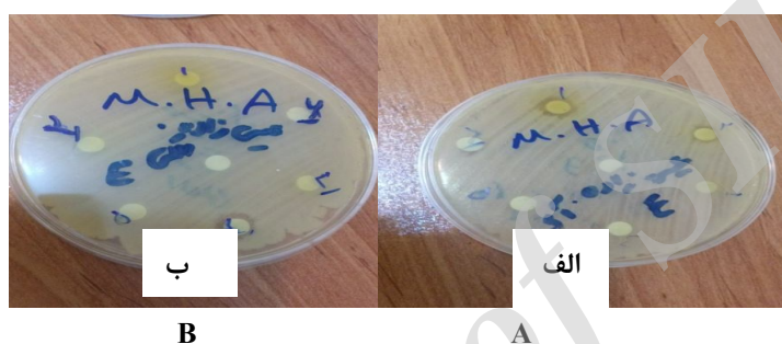
شکل ۱- قطر هاله مهار رشد عصاره آبی (الف) و (ب) عصاره الکلی اسفناج روی اشرشیاکلی.

تعیین اثر ضدباکتریایی عصاره‌های مورد آزمون به روش انتشار دیسک: ابتدا سوسپانسیون باکتریایی با کدورت معادل نیم مک فارلند تهیه سپس با استفاده از سوآپ استریل روی سطح پلیت‌های حاوی محیط کشت مولر هیتون آگار عمل کشت انجام شد. دیسک‌های کاغذی با قطر ۶ میلی‌متر ساخت شرکت سیگما حاوی ۱۰۰ میکرولیتر از عصاره‌های مورد مطالعه روی پلیت‌ها منتقل و به مدت ۲۴ ساعت در انکوباتور ۳۷ درجه سانتی‌گراد گرم‌خانه‌گذاری گردید. پس از گرم‌خانه‌گذاری، قطر هاله مهار رشد مورد اندازه‌گیری قرار گرفت (۱۳).