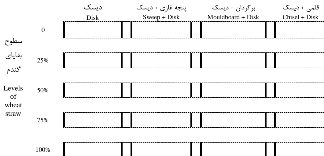
شکل ۱- اجرای آزمایش بر اساس طرح اسپلیت بلوک