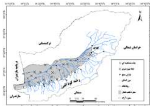
شکل (۱): جانمایی آبخوان آبرفتی در استان گلستان