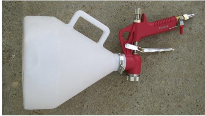
شکل ۲. بیستوله جهت پاشش مالچ

تصادفی با نرم افزار SAS^1 9.1 مورد ارزیابی قرار گرفت. نفوذسنج مورد استفاده مدل جیبی ۲ بوده و قابلیت نمایش حداقل ۵۰ نیوتن بر میلی‌مترمربع و حداکثر ۹۰۰ نیوتن بر میلی‌مترمربع را دارد.