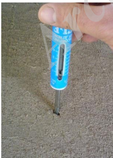
شکل ۳. انجام آزمایش مقاومت فشاری با استفاده از نفوذسنج جیبی

برای ارزیابی مقاومت مالچ‌ها و مقدار شستشوی سطحی آنها در برابر جاری شدن آب و رطوبت دهی (مثل باران)، با استفاده از آب‌پاش مقدار ۵۰۰ سی‌سی آب به روی تیمارها پاشش شد. همچنین مقدار ۵۰۰ سی‌سی آب نیز بدون عمل پاشیدن به روی نمونه‌ها سرازیر شد. همچنین برای درک بهتر اثر پاشیدن آب بر روی تیمارها، تعدادی از سطوح به صورت شیب‌دار به عنوان زبری پستی و بلندی تهیه شدند (شکل ۴).