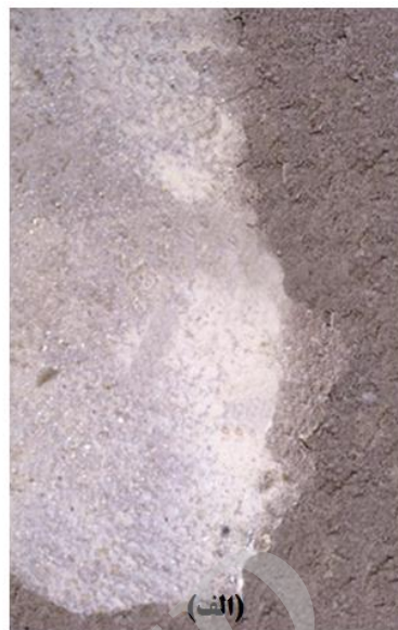
شکل ۴. پاشش و جاری ساختن آب به روی تیمارها، الف) مالچ AI (% خاک با بافت رسی، ۱۰٪ لجن کنور تور، ۵٪ پودرسنگ) و خاک با فرسایش متوسط، ب) مالچ پلیمری و خاک فرسایش شدید با سطح صاف و شیب‌دار.