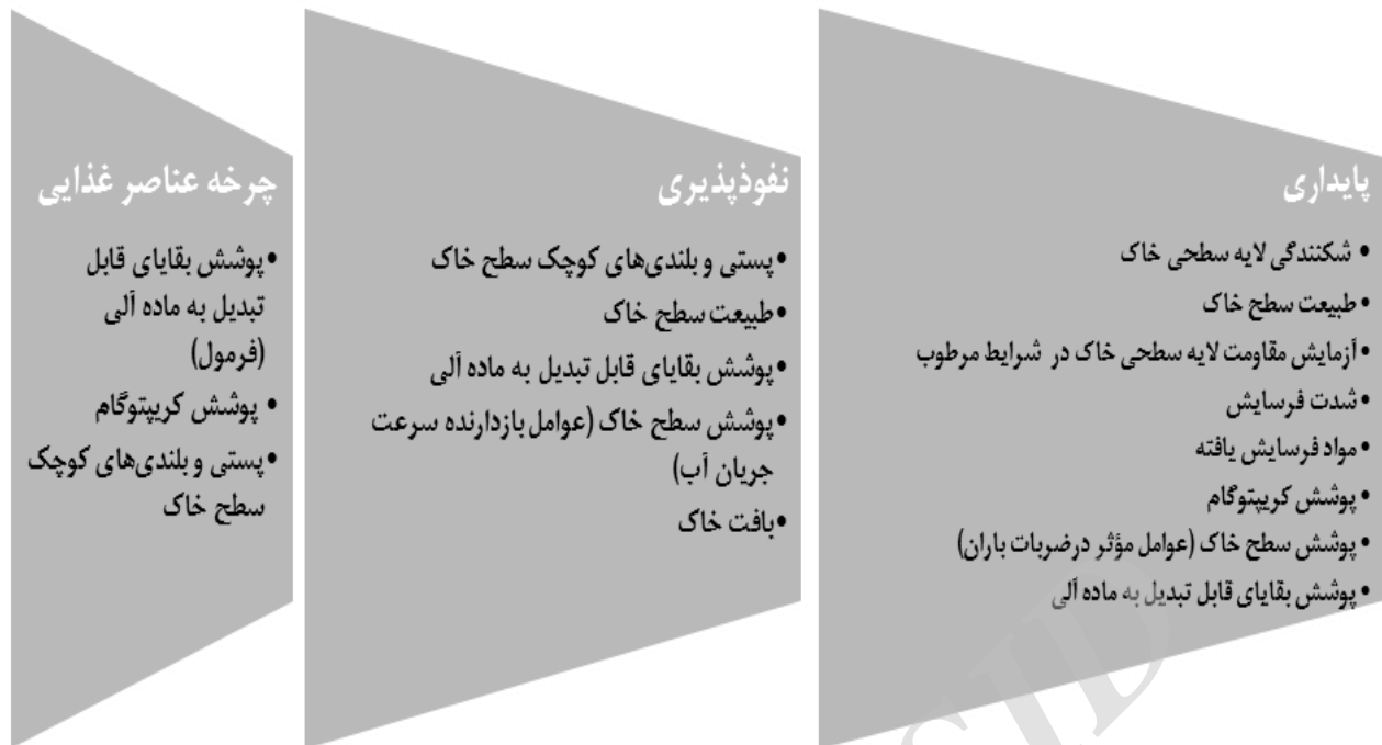
شکل ۲- ارتباط هر شاخص با ویژگی‌های سه‌گانه اصلی شامل پایداری، نفوذپذیری و چرخه مواد غذایی (اقتباس از Tongway & Hindley, 2004)