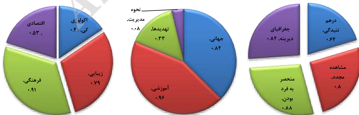
شکل ۳. امتیازهای هر یک از زیرمعیارها در ارزش‌های علمی، افزوده و ترکیبی