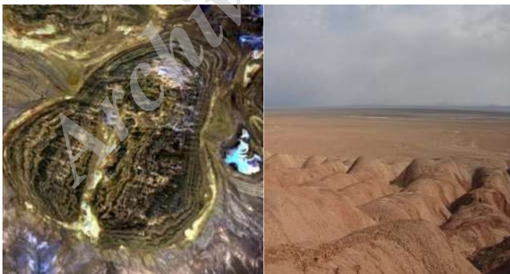
شکل ۲. نمای از گنبد نمکی جنوب سمنان (سمت راست عکس گنبد نمکی، سمت چپ تصویر ماهواره‌ای (۱۸)).

که در آن ScV ارزش علمی ژئومورفوسایت، AdV عیار مکمل ژئوسایت، Ra : نایاب بودن نسبت به منطقه، In : دست‌نخورده‌گی و سالم بودن، Rp : قابلیت آموزش فرآیندهای ژئومورفولوژیک، Dv : تعداد اشکال ژئومورفولوژیک جالب، Ge : دیگر اشکال زمین‌شناسی با ارزش میراثی، Kn : دانش علمی در زمینه مسائل ژئومورفولوژی: Rn : کم‌پاب بودن چشم‌اندازها در سطح ملی، Cult : ارزش فرهنگی، Aest : ارزش زیبایی شناختی، Ecol : ارزش اکولوژیکی. UsV : ارزش استفاده، PrV : عیار ارزش محافظت، Ac : میزان دسترسی، Vi : قابلیت رویت، Gu : استفاده حاضر از دیگر جذابیت‌های طبیعی و فرهنگی، Ou : تجهیزات و سرویس‌های پشتیبانی، Lp : قوانین محافظت و محدودیت استفاده، Eq : استفاده کنونی از دیگر جذابیت‌های کنونی، In : میزان دست‌نخورده‌گی، و Vu : آسیب‌پذیری در صورت بهره‌گیری از