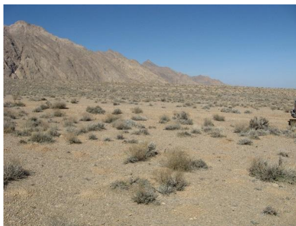
شکل 1. نمایی از سایت پورتکی

1380-1395 در منطقه مورد مطالعه نشان‌دهنده آن است که وضعیت رطوبت در هیچ‌کدام از ماه‌های سال بالا نبوده به طوری که طول فصل خشک 12 ماه و نوسانات بارندگی بین 0 تا 15/22 میلی‌متر در ماه است (شکل 2).