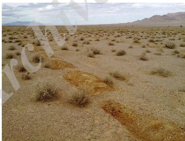
شکل 3. ایجاد پیتینگ در محل مورد بررسی

میانگین‌ها با استفاده از آزمون چند دامنه‌ای دانکن انجام شد.