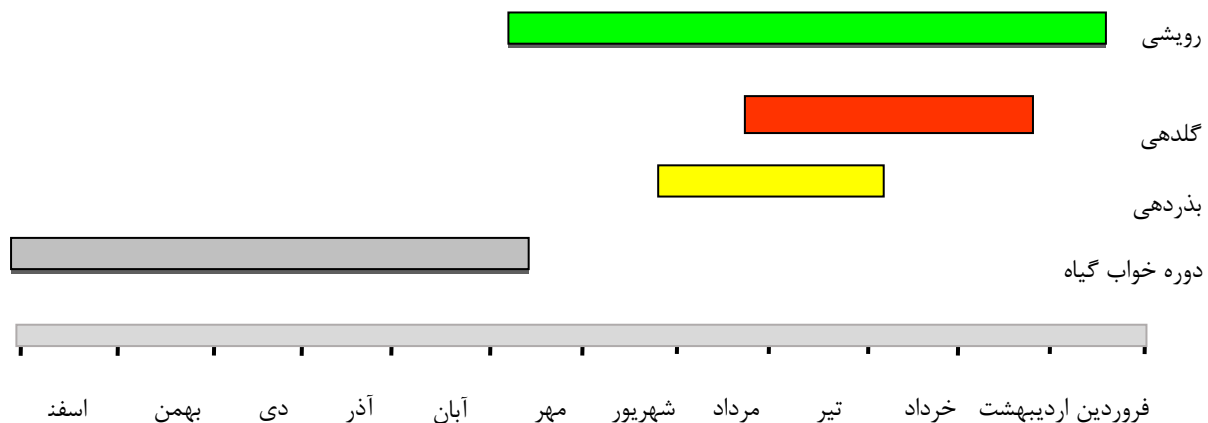
شکل ۲. نمایش طول مدت بروز فعالیت های زیستی در گونه شمع بیابانی

این سیکل نوسانات رژیم حرارتی در منطقه از سالی به سال دیگر با تغییرات جزئی به طور پیوسته