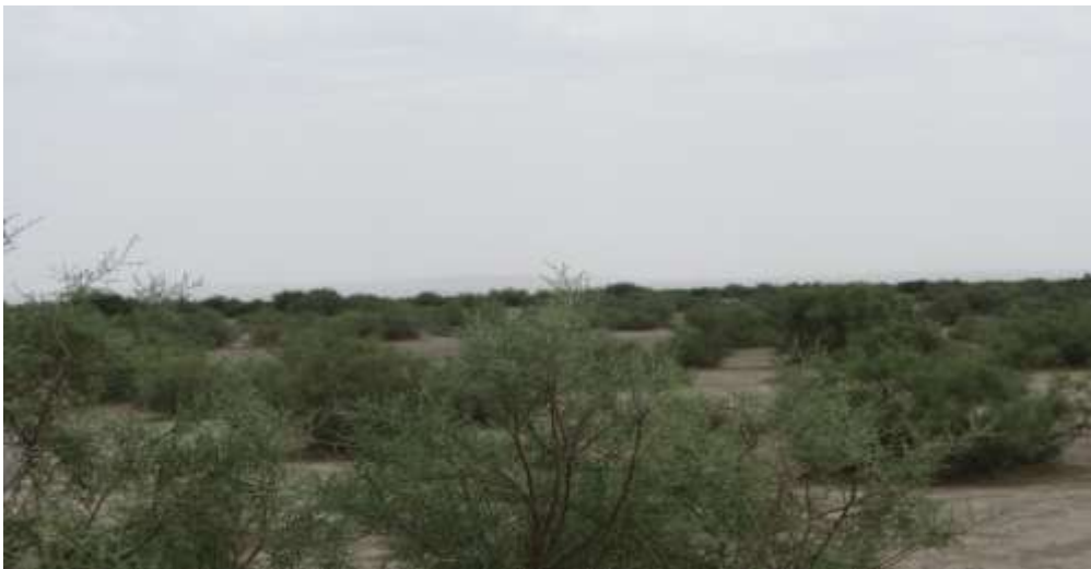
شکل ۲. نمایی از جنگل گز در دشت فرخ آباد دهلران