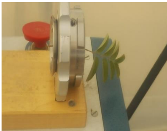
شکل ۱. دستگاه بمب فشار

واحد اعداد این دستگاه بر حسب " \text{mmol m}^{-2}\text{s}^{-1} " نشان داده می‌شود. در زمان یادداشت برداری، دما و زمان هم ثبت شد.