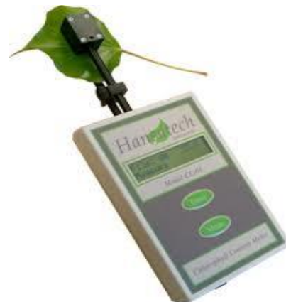
شکل ۳. دستگاه اسپد

محتوی کلروفیل نسبی برگ به روش غیرتخریبی با استفاده از دستگاه Chlorophyll Content Meter یا SPAD Model CL-01 اندازه‌گیری شد (۳، ۱۸ و ۳۷) (شکل ۳). اعداد خوانده شده توسط دستگاه، مجموع مقدار کلروفیل a و b موجود در گیاه (mg g -1 ) است (۱۱، ۲۰ و ۴۲). به منظور کاهش خطای اندازه‌گیری غلظت کلروفیل نسبی، در هر نقطه سه تکرار انجام شد و در آخر میانگین مقدارهای اندازه‌گیری شده به عنوان کلروفیل نسبی ثبت شد. بدین منظور سه پایه از هر نهال به طور تصادفی انتخاب و از سه نقطه آخرین برگ توسعه یافته نمونه‌گیری و اندازه‌گیری انجام شد. عدد بدست آمده میزان سبزی‌نگی گیاه را نشان می‌دهد. برای به‌دست آوردن غلظت کلروفیل برگ گیاه لازم است دستگاه واسنجی شود. این کار برای چهار گونه مورد بررسی انجام و عدد پایانی ثبت شد (۳۶).