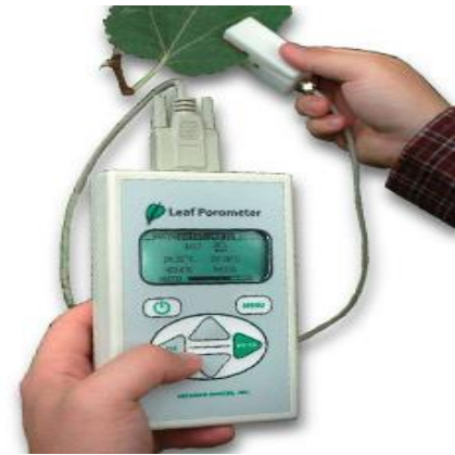
شکل ۲. دستگاه پرومتر دستی

محتوی کلروفیل برگ پس از آبیاری به روش کاهش یافت، اما این کاهش معنی‌دار نبود ( P > 0.05 ). به طوری که اختلاف محتوی کلروفیل چهار گونه مورد مطالعه قبل و بعد از آبیاری به روش معادل ۱/۵، ۲/۸۳، ۲/۱۶ و ۲/۲۴ "mg g -1 " به ترتیب برای گونه‌های افاقیا، عرعر، زیتون تلخ و توت سفید مشاهده شد.