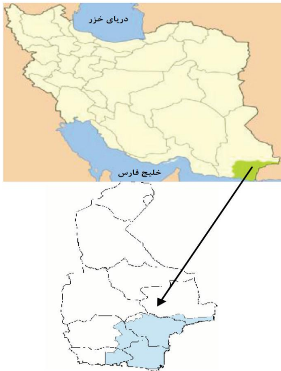
شکل ۱. منطقه مطالعه شده

این‌رو، مطالعه حاضر با هدف تعیین اولویت بهره‌برداری منابع آب این منطقه با استفاده از یکی از روش‌های تصمیم‌گیری چندشاخصه (تکنیک تحلیل سلسله‌مراتبی فازی) انجام شده است.