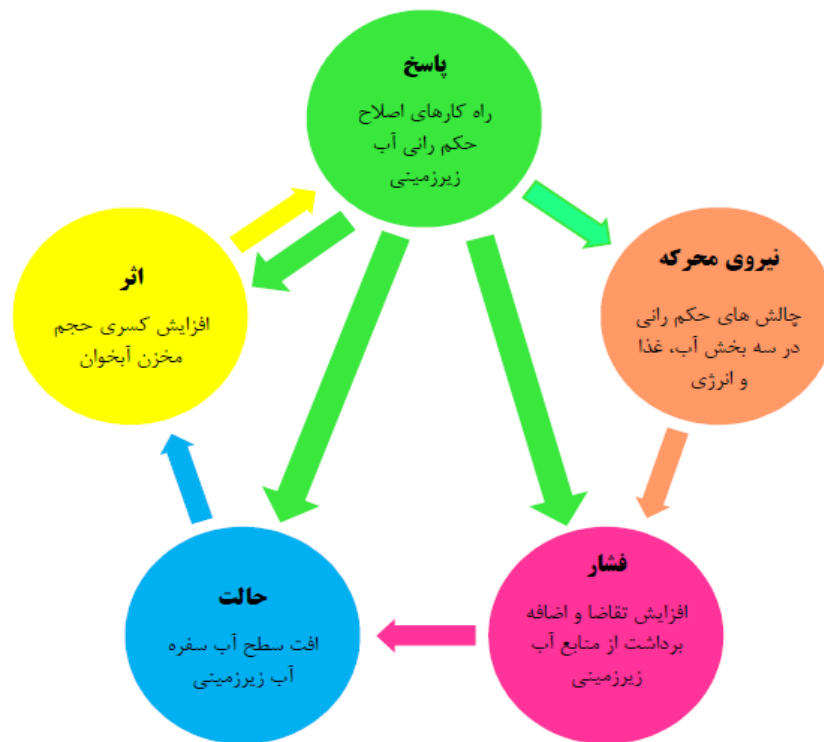
شکل ۳. چارچوب مدل مفهومی DPSIR در سامانه حکمرانی آب زیرزمینی با رویکرد بررسی عوامل پیوندی آب، غذا و انرژی

حاضر از چارچوب DPSIR به منظور ارزیابی هریک از چالش‌های حکمرانی آب زیرزمینی شناسایی‌شده توسط بازیگران، بررسی فشار واردشده توسط هر چالش بر وضعیت کمی منابع آب زیرزمینی و آثاری که بر آبخوان خواهد داشت و نیز ارائه راه‌کارهای بهبود حکمرانی در قالب اصلاح قوانین و زیرساخت‌ها در بخش‌های آب، غذا و انرژی استفاده شده است. شکل ۳ نمای کلی چارچوب مدل مفهومی DPSIR در سامانه حکمرانی آب زیرزمینی را نشان می‌دهد. با توجه به شکل ۳، در پژوهش حاضر از