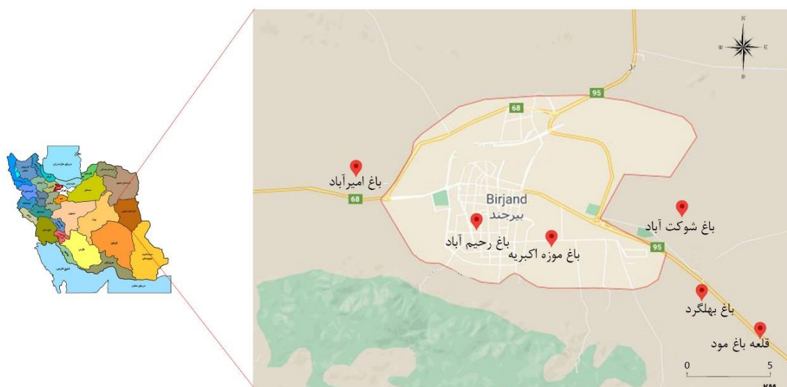
شکل ۱. موقعیت مکانی باغ‌های مطالعه‌شده

یکی از نقاط شکل‌گیری شیوه خاصی از مفاهیم باغ ایرانی، شهر بیرجند در استان خراسان جنوبی است. بیرجند به عنوان شهری که رونق و شکوفایی خود را در دوره صفویه به دست آورده است، مجموعه‌ای از باغ‌های تاریخی متعلق به دوره قاجار و پهلوی اول دارد. بررسی ویژگی‌ها و شاخص‌های باغ‌های بیرجند در مقایسه با دیگر باغ‌های ایران، نشان از شیوه متفاوتی در طراحی دارد. به این منظور، آب از عناصر اصلی در باغ است که بخشی از آن برای آبیاری گیاهان و قسمتی، به منظور خلق زیبایی در طراحی استفاده می‌شود [۱۸]. نقش آب در باغ‌سازی در بیرجند، فقط نقش کارکردی نیست، بلکه حضور آب در باغ ترکیبی از شکل عینی و شکل حسی است. در واقع، معماری باغ، معماری آب است و درهم‌آمیختگی آب و بنا، پدیده‌آوردنده حماسه‌ای بی‌نظیر از شعر، شکوه و موسیقی در