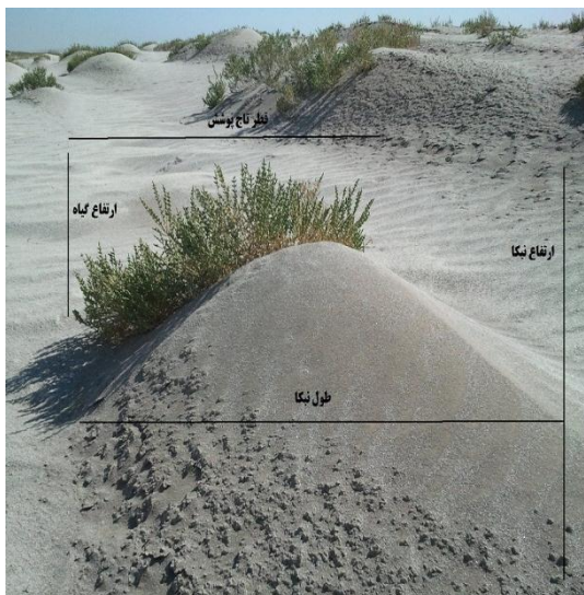
شکل (۲): نمایی از پارامترهای اندازه گیری شده روی نمکا