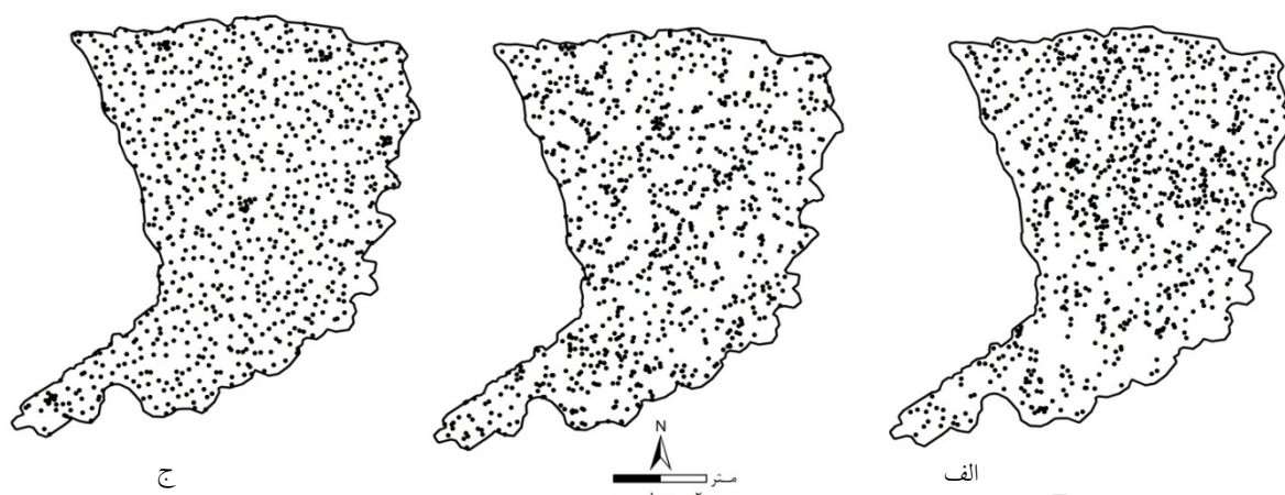
شکل ۲. محدوده پژوهش در توده طبیعی بنه با آرایش کپه‌ای (الف)، توده شبیه‌سازی شده تصادفی (ب) و پراکنده (ج) که هر سه توده دارای تعداد درختان (۸۷۵ درخت) و مساحت (۴۵ هکتار) مشابه هستند.