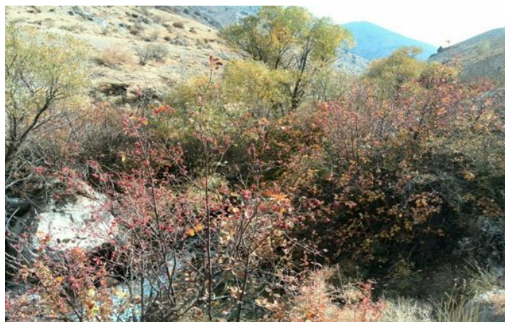
شکل ۲. تصویری از درختان بارانک در منطقه مورد مطالعه (رنگی در نسخه الکترونیکی)