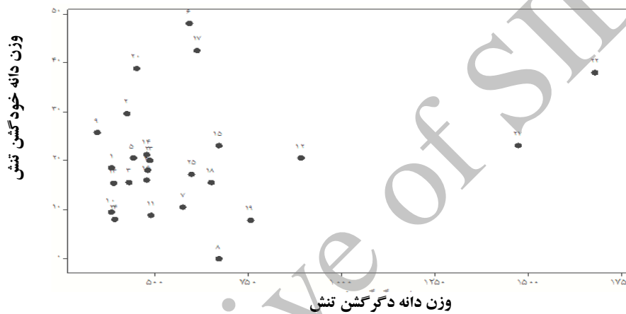
شکل ۴. نمودار بای پلات وزن دانه خودگشن (mg) در برابر وزن دانه دگرگشن (mg) تحت شرایط تنش

لاین‌های خالص را تسریع بخشند، یاری می‌نماید. در گیاهان علوفه‌ای چمنی دگرگشن به دلیل سخت بودن تولید لاین خالص (به دلیل خودناسازگاری) مرسوم‌ترین روش به نژادی ایجاد واریته ترکیبی می‌باشد (۲۱). با این وجود برای انجام برخی مطالعات اصلاحی از جمله تشکیل جوامع نقشه‌یابی و مطالعات تجزیه ژنتیکی وجود لاین‌های خالص بسیار راه‌گشا است. نتایج مطالعه حاضر نشان داد که اگرچه میزان خودناسازگاری در بروم‌گراس نرم بسیار بالاست لیکن بین ژنوتیپ‌های مورد بررسی از نظر خودناسازگاری تنوع ژنتیکی قابل ملاحظه‌ای وجود دارد که می‌توان از آنها در جهت تولید لاین‌های خالص در برنامه‌های اصلاحی آینده سود جست.