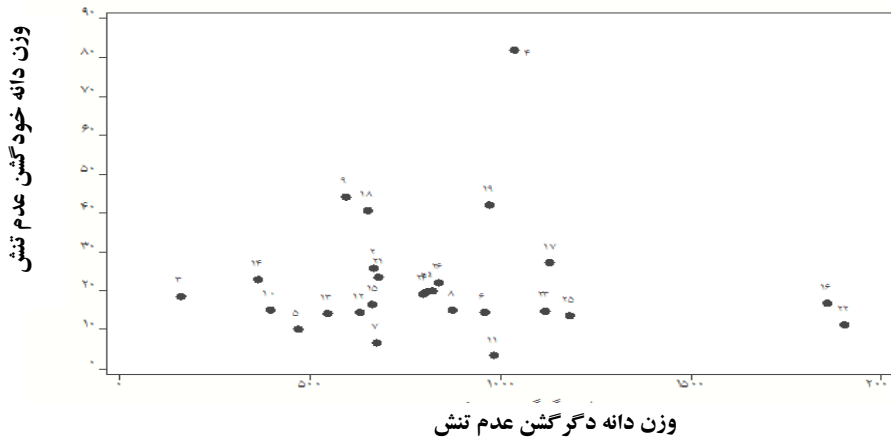
شکل ۳. نمودار بای پلات وزن دانه خودگشن (mg) در برابر وزن دانه دگرگشن (mg) تحت شرایط عدم تنش