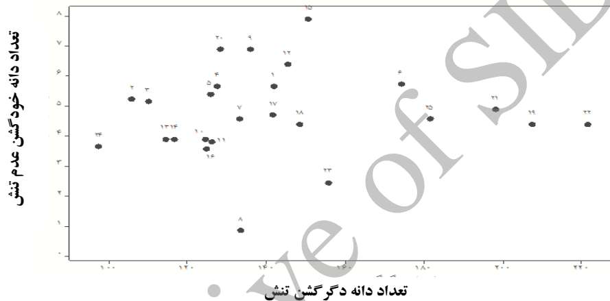
شکل ۲. نمودار بای پلات تعداد دانه خودگشن در برابر تعداد دانه دگرگشن تحت شرایط تنش

در شرایط عدم تنش نسبت به شرایط تنش بیشتر می‌باشد. ژنوتیپ ۱۴ ژنوتیپی است که به‌طور کلی در هر دو شرایط محیطی (عدم تنش و تنش) در حالت دگرگشنی تعداد دانه کم تشکیل داد.