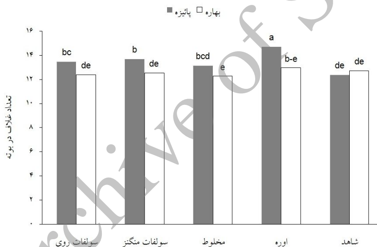
شکل ۳. اثر متقابل محلول پاشی با فصل کاشت بر تعداد غلاف در بوته نخود در کشت‌های بهاره و پائیزه میانگین‌های دارای حروف مشابه بر اساس آزمون LSD فاقد اختلاف آماری معنی‌دار در سطح احتمال ۵ درصد می‌باشند.

در هر ستون و برای هر تیمار میانگین‌های دارای حروف مشترک، در سطح احتمال ۵ درصد، اختلاف معنی‌داری ندارند.