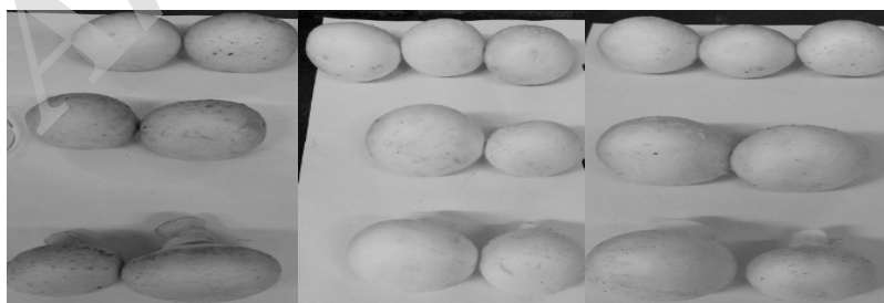
شکل ۳. تغییر رنگ قارچ‌های نگهداری شده در دمای یخچال و در ظرف پوشیده شده با فویل (به‌ترتیب از راست به چپ در روز سوم، هفتم و بیست‌وپنجم)