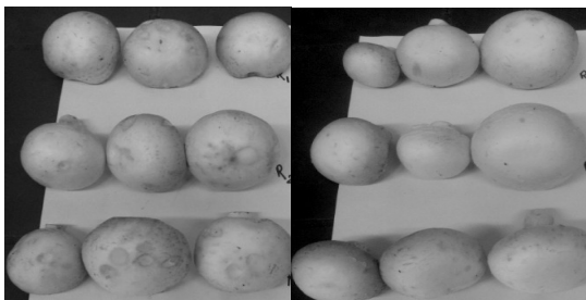
شکل ۵. تغییر رنگ قارچ‌های نگهداری شده در دمای محیط و در ظرف پوشیده شده با فویل. (به ترتیب از راست به چپ در روز سوم و هفتم)

معنی‌دار بود ولی اثر نوع ظرف معنی‌دار نبود. قارچ‌های پرورش یافته در کمپوست کلش برنج و تفاله زیتون بیشترین درصد ماده خشک در روز هفتم (به ترتیب ۹/۱۵٪ و ۱۱/۶۲٪) را در یخچال و اتاق نشان دادند که اختلاف معنی‌داری با قارچ‌های پرورش یافته در کمپوست شاهد در سطح احتمال یک درصد داشتند (جدول ۴). به‌علت از بین رفتن قارچ‌های نگهداری شده در دمای اتاق، در روز هفتم، لازم شد تجزیه جداگانه‌ای نیز برای نمونه‌های یخچال تا روز بیست‌وپنجم انجام شود که نتایج اندازه‌گیری‌ها در این مقاله نیامده است.