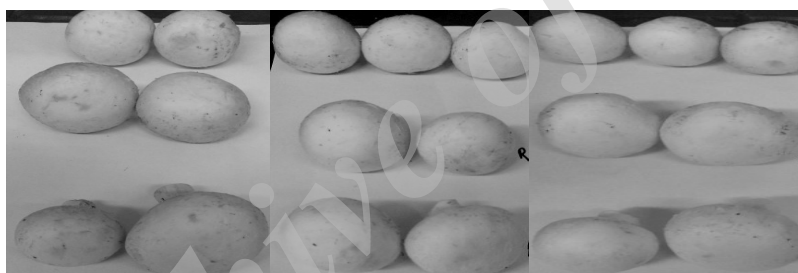
شکل ۲. تغییر رنگ قارچ‌های نگهداری شده در دمای یخچال و در ظرف شفاف (به‌ترتیب از راست به چپ در روز سوم، هفتم و بیست‌وپنجم)

حروف متفاوت در هر ستون، نشان‌دهنده وجود اختلاف معنی‌دار به‌ترتیب در سطح احتمال ۵ درصد و ۱ درصد براساس آزمون توکی می‌باشد.