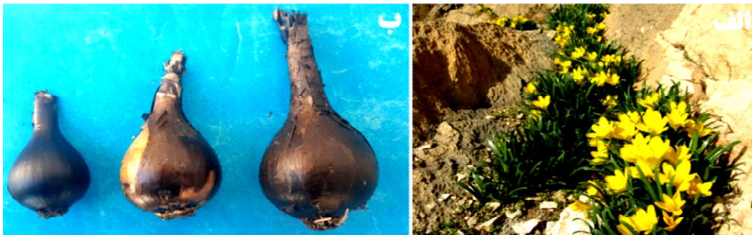
شکل ۱. الف) گل‌دهی جام‌زرین پاییزه در اواخر آذرماه در رویشگاه طبیعی آن در شهرستان چرداول استان ایلام و ب) سه اندازه سوخ آن

سبز شدن، ظهور ساقه گل‌دهنده، گل‌دهی، طول ساقه، قطر ساقه و طول برگ مشاهده شده است (۱۳).