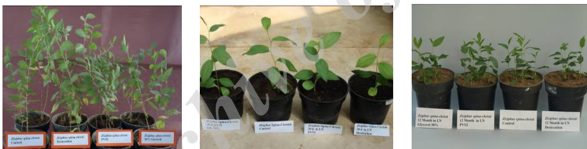
شکل ۲: استقرار و رشد نهال‌های حاصل از یک هفته، یک ماه و یک سال ذخیره‌سازی در نیتروژن مایع با پیش تیمارهای مختلف همراه با شاهد در شرایط گلخانه