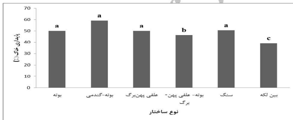
شکل ۱- شاخص پایداری خاک در چشم‌انداز مورد مطالعه بین لکه‌های گیاهی مختلف

** نشان‌دهنده اختلاف معنی‌داری در سطح یک درصد می‌باشد.