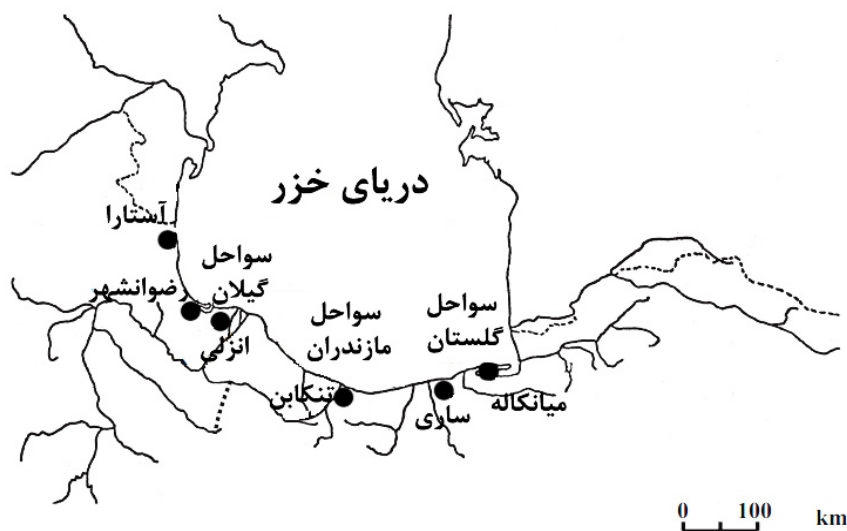
شکل ۱- نقشه موقعیت مناطق مورد مطالعه در حوضه جنوبی دریای خزر

در این مطالعه برای بررسی جمعیت شگ‌ماهیان حوضه جنوبی دریای خزر، از روش‌های ریخت‌سنجی سنتی استفاده شد. برای تعیین تنوع ریختی بین ۶ ایستگاه، ۳۳ صفت ریختی و ۱۰ فاکتور شمارشی مورد بررسی قرار گرفت. متغیرهای وابسته به طول شامل طول کل، طول چنگالی، طول استاندارد، ارتفاع بدن، عرض بدن، ارتفاع ساقه دم، طول سر، عرض سر، ارتفاع سر، طول پوزه، قطر چشم، فاصله پشت چشم تا انتهای سرپوش آبشش، فاصله بین دو حدقه چشم، فاصله ابتدای باله پشتی تا نوک پوزه، فاصله انتهای باله پشتی تا انتهای باله دم، فاصله نوک پوزه تا ابتدای باله مخرجی، فاصله انتهای باله مخرجی تا ابتدای باله دم، فاصله نوک پوزه تا ابتدای باله شکمی، فاصله انتهای باله شکمی تا ابتدای باله دم، طول باله پشتی، ارتفاع باله پشتی، قاعده باله پشتی، طول باله مخرجی، قاعده باله مخرجی، ارتفاع باله مخرجی، طول باله شکمی، طول باله سینه‌ای، فاصله ابتدای باله لگنی تا ابتدای باله سینه‌ای، فاصله ابتدای باله پشتی تا ابتدای باله مخرجی، فاصله ابتدای باله لگنی تا ابتدای باله مخرجی، فاصله ابتدای باله مخرجی تا انتهای باله پشتی، قطر ساقه دم و انتهای باله مخرجی تا ابتدای باله دم به وسیله کولیس دیجیتالی با دقت یک صدم میلی‌متر اندازه‌گیری شدند و صفات شمارشی شامل تعداد خارهای باله پشتی، تعداد شعاع‌های نرم باله پشتی، تعداد خارهای باله مخرجی، تعداد شعاع‌های نرم باله مخرجی، تعداد شعاع‌های نرم باله شکمی سمت چپ، تعداد خارهای باله شکمی سمت چپ، تعداد شعاع‌های نرم باله سینه‌ای سمت چپ، تعداد خارهای باله سینه‌ای سمت چپ و تعداد خارهای آبششی خارجی در زیر لوپ