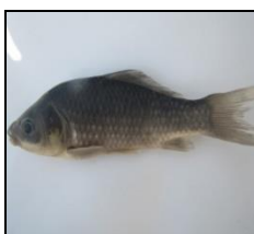
کاراس C. auratus