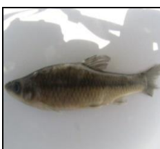
پاروا P. parva