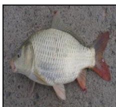
کپور معمولی C. carpio