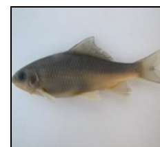
بوتک C. macrostomum